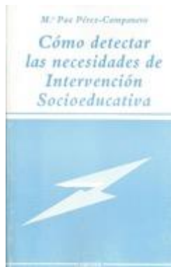
EDUCATIVA 461 CÓMO DETECTAR LAS NECESIDADES DE INTERVENCIÓN SOCIOEDUCATIVA Pérez-Campanero, M.P. Edita: Narcea