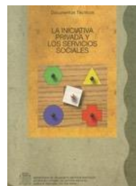
SOCIAL 343 LA INICIATIVA PRIVADA Y LOS SERVICIOS SOCIALES Edita: Ministerio de Trabajo y Asuntos Sociales