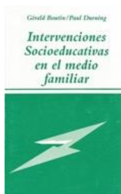
SOCIAL 344 INTERVENCIONES SOCIOEDUCATIVAS EN EL MEDIO FAMILIAR Boutin, G.; Durning, P. Edita: Narcea