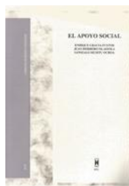
SOCIAL 342 EL APOYO SOCIAL Gracia, E.; Herrero, J.; Musitu, G. Edita: Promociones y Publicaciones Universitarias