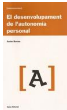
EVOLUTIVA 89 EL DESENVOLUPAMENT DE L'AUTONOMIA PERSONAL Bornas, Xavier Edita: Eumo