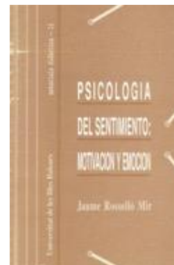
GENERAL 401 PSICOLOGÍA DEL SENTIMIENTO: MOTIVACIÓN Y EMOCIÓN Roselló Mir, Jaume Edita: Universitat Illes Balears