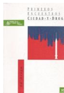
TOXICOMANIES 95 PRIMEROS ENCUENTROS. CIUDAD Y DROGA Edita: Fundación Pública de Servicios Sociales