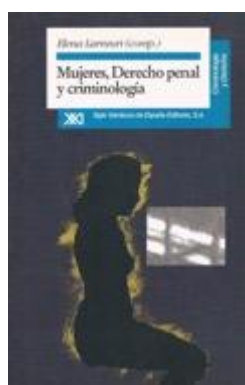
JURÍDICA 132 MUJERES, DERECHO PENAL Y CRIMINOLOGÍA Larrauri, Elena (comp.). Edita: Siglo XXI de España