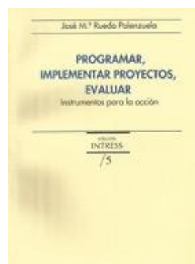
SOCIAL 339 PROGRAMAR, IMPLEMENTAR PROYECTOS, EVALUAR. INSTRUMENTOS PARA LA ACCIÓN Rueda Palenzuela, J.M. Edita: Intress