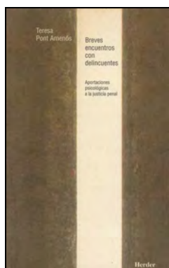
JURIDICA 120 BREVES ENCUENTROS CON DELINCUENTES. Pont Amenós, Teresa Edita: Herder