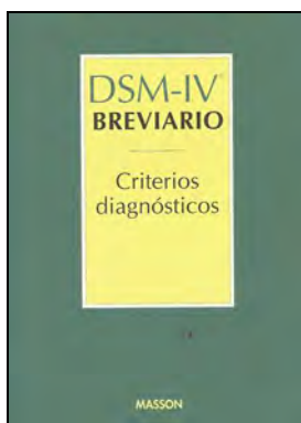
CLÍNICA 741 DSM-IV. BREVIARIO. Edita: Masson