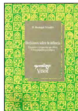
SOCIAL 303 DECISIONES SOBRE LA INFANCIA. Schaffer, H. Rudolph Edita: Visor