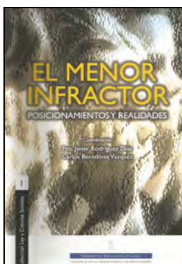
JURIDICA 122 EL MENOR INFRACTOR. Rodríguez, Fco. Javier Becedóniz, Carlos (Coords.) Edita: Gobierno del Principado de Asturias