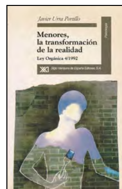
JURIDICA 119 MENORES, LA TRANSFORMACIÓN DE LA REALIDAD. Urra Portillo, Javier Edita: Siglo XXI