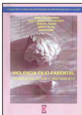
JURIDICA 121 VIOLENCIA FILIO-PARENTAL. Urra, Javier (Dir.) Edita: Klinik