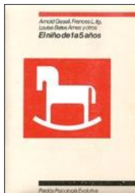
EVOLUTIVA 87 EL NIÑO DE 1 A 5 AÑOS. Gesell, Arnold Edita: Paidós