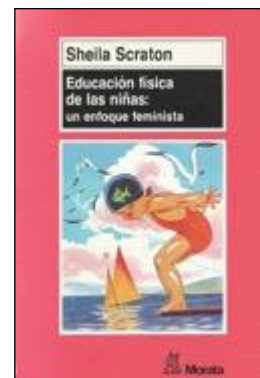
GÈNERE 13 EDUCACIÓN FÍSICA DE LAS NIÑAS: UN ENFOQUE FEMINISTA. Scraton, Sheila Edita: Morata