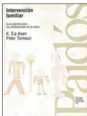
TERÀPIA FAMILIAR 66 INTERVENCIÓN FAMILIAR. Asen, K. Eia Tomson, Peter Edita: Paidós