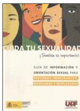
SEXOLOGIA 56 CUIDA TU SEXUALIDAD. Edita: Unión de Asociaciones Familiares