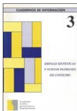
TOXICOMANIES 104 DROGAS SINTÉTICAS Y NUEVOS PATRONES DE CONSUMO. Edita: Coordinadora de ONG's que Intervienen en Drogodependencias