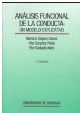
CLÍNICA 787 ANÁLISIS FUNCIONAL DE LA CONDUCTA: UN MODELO EXPLICATIVO. Segura, M.; Sánchez, P.; Barbado, P. Edita: Universidad de Granada