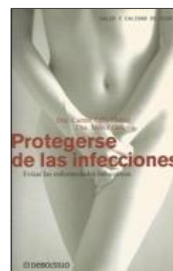
VIH/SIDA 54 PROTEGERSE DE LAS INFECCIONES. Valls-Llobet, Carme Gascó, Mercè Edita: Plaza & Janés