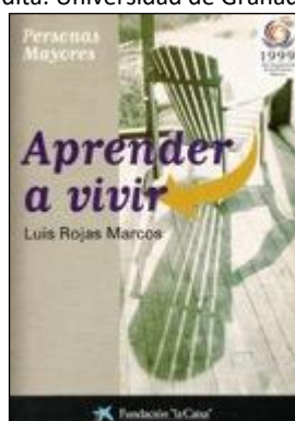
MAIORS 118 APRENDER A VIVIR. Rojas Marcos, Luis Edita: Fundación "La Caixa"