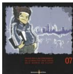
SOCIAL 332 DADES PER A UN CONEIXEMENT DE LA REALITAT DELS JOVES DELS BARRIS DE CIUTAT. Edita: Ajuntament de Palma