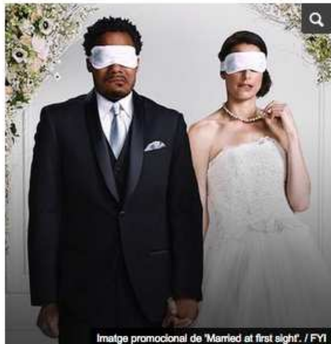
Imatge promocional de 'Married at first sight'.

Al programa 'Casats a primera vista', un grup de professionals de la psicologia i la psiquiatria, després d'examinar un test de 400 preguntes, entrevisten individualment candidats per completar-ne els perfils i formar parelles. Després aquestes persones es casen sense haver-se conegut abans i conviuen almenys durant un mes. Així, el COPIB assenyala que, si bé no és la seva funció desprestigiar els professionals de la psicologia col·laboradors del programa, sí que ho és advertir que "les relacions humanes són molt més complexes del que es pugui mostrar al món televisiu tan superficial, banal i intranscendent però d'enorme repercussió i influència en determinats sectors de la societat".