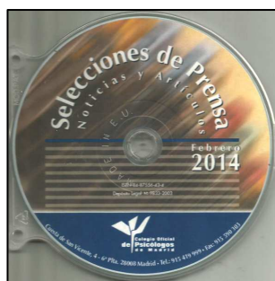
AUDIOVISUAL 1 SELECCIONES DE PRENSA. Febrero 2014. Edita: Colegio Oficial de Psicólogos de Madrid