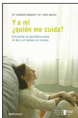
CLINICA 610 Y A MÍ ¿QUIÉN ME CUIDA?. Ramajo, M a Carmen Mateo, M a José Edita: ISEP