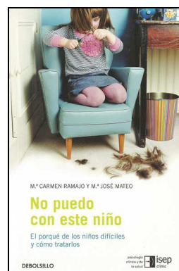
EDUCATIVA 411 NO PUEDO CON ESTE NIÑO. Ramajo, M a Carmen Mateo, M a José Edita: ISEP