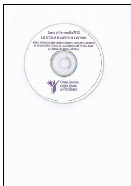
JURÍDICA 114 CURSO DE FORMACIÓN 2013. LAS OFICINAS DE ASISTENCIA A VÍCTIMAS. Edita: Consejo General de Colegios Oficiales de Psicólogos