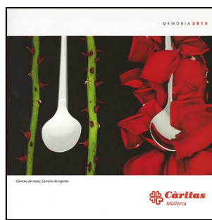
MEMORIES 101 CÀRITAS MALLORCA. MEMÒRIA 2013. Edita: Càritas Mallorca.