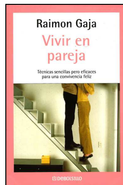
TERAFAMI 28 VIVIR EN PAREJA. Gaja, Raimon. Edita: Random House Mondadori